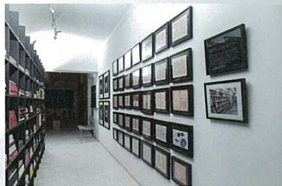
左：工作室也有陳列林偉而的一些作品，如《藝術家的桌子》 中：João Vasco Paiva 的作品《無題：來自灣仔街市 2》(Untitled - from the Wanchai Market 2, 2013)，以石樹脂倒出一個發泡膠箱的形狀，再繪上漆，發泡膠箱是香港社區常見之物 右：右邊牆上的是香港藝術家白雙全的作品《P22：摺了一半的圖書館》(Page 22 - Half Folded Library, 2008)，藝術家於 2008 年 3 月 6 日至 6 月 24 日將紐約公立圖書館一半圖書（15500 本）的第 22 頁摺了個小角